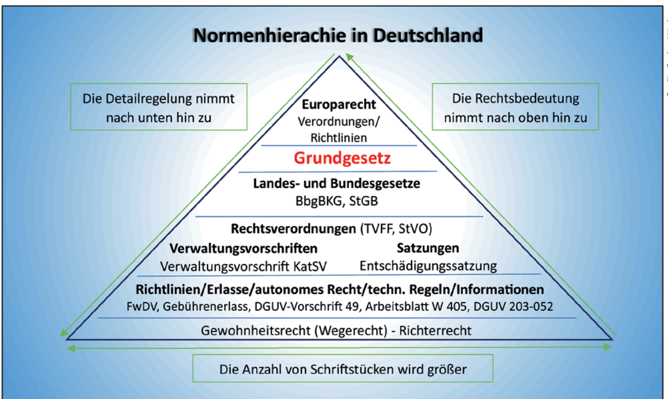
Abb. 1: Aufbau der Rechtsordnung (Normenpyramide)

Die Rechtsordnung ist die Gesamtheit aller Normen innerhalb eines Rechtsstaates. Das System aus Regeln schreibt vor, wie das Rechtssystem funktioniert. Das Recht wird in Deutschland in die Rechtsgebiete Zivilrecht, öffentliches Recht und Strafrecht aufgeteilt. An der Spitze der Rechtsordnung steht grundsätzlich das Grundgesetz als Verfassung. Mit Weiterentwicklung der Europäischen Union (EU) dringt das Europarecht immer mehr in die nationale Rechtsordnung ein. Das Europarecht rückt praktisch an die Spitze und hat Vorrang, solange der Kern der Verfassung der Bundesrepublik gewahrt bleibt.