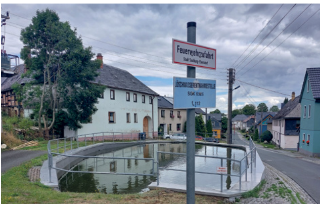
Abb. 4: Löschteich