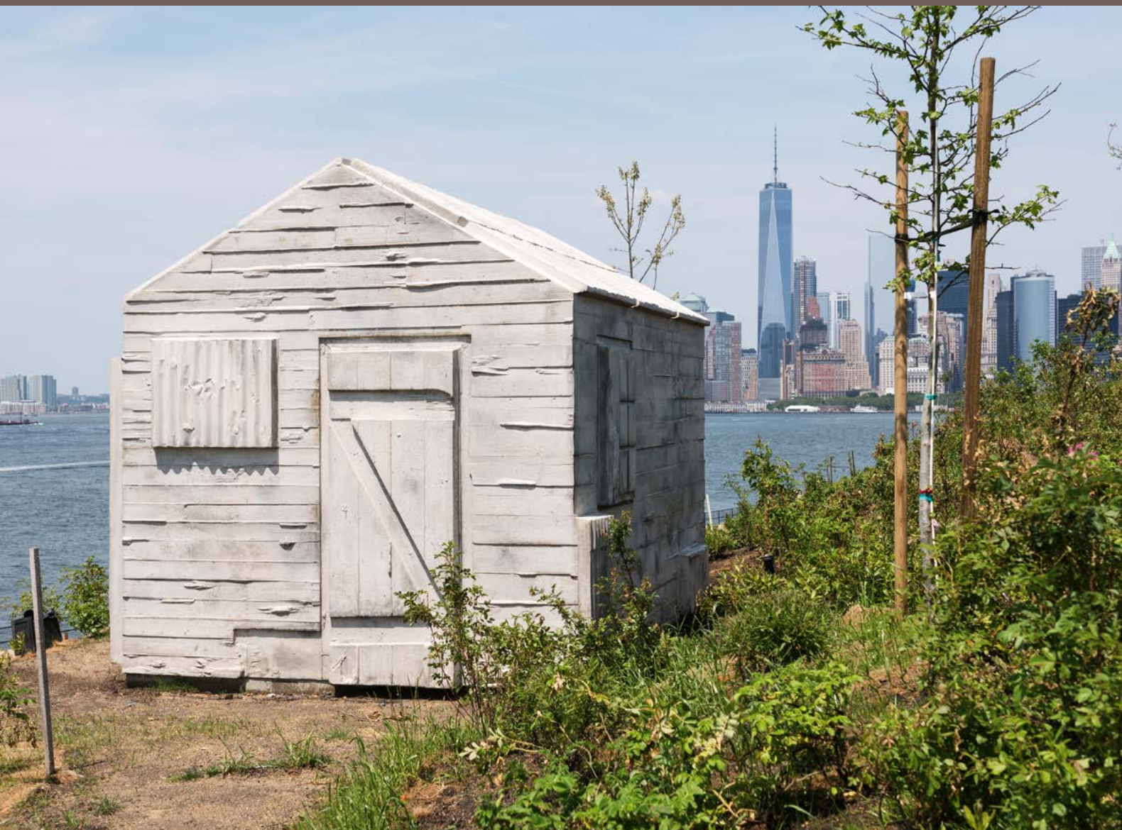
Rachel Whiteread (geb. 1963), Cabin (Hütte), 2015