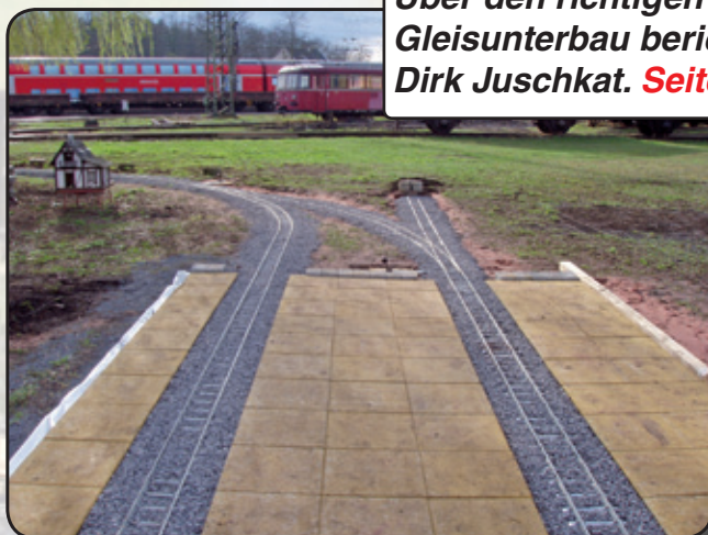
Über den richtigen Gleisunterbau berichtet Dirk Juschkat. Seite 12